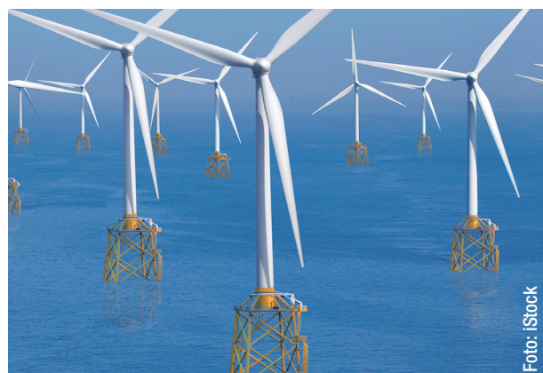
Jacket-Gründungen für Offshore-Windparks